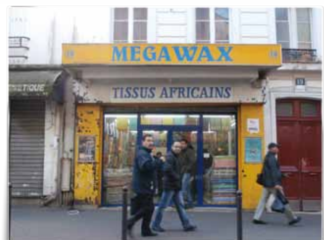
> Exemples de commerces originaires d'Afrique sub-saharienne