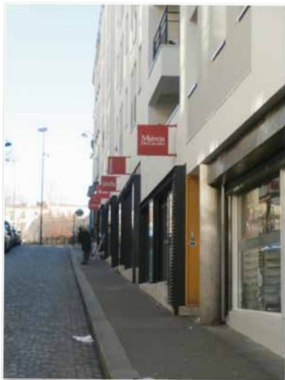
> La rue des Gardes a fait l'objet d'une opération de réhabilitation de locaux commerciaux en 2000.

Dès 2011, les premiers dispositifs de formations ont ouvert dans le quartier. Ils visent autant à répondre aux