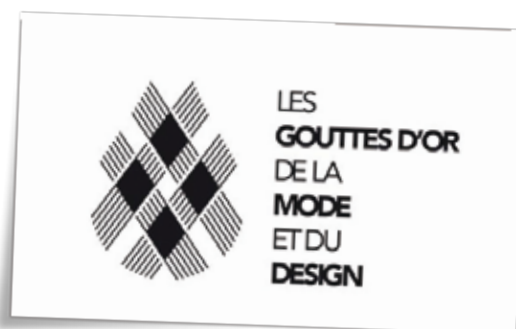
> Le logo de la filière